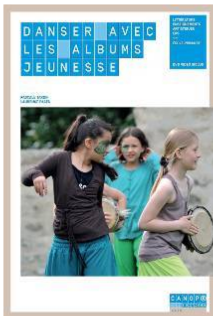
Danser avec les albums jeunesse

Cochez les albums proposés pour le cycle2