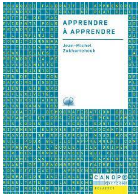
Apprendre à apprendre

J.M Zakhartchouk évoque la mémorisation à court terme et à long terme. Combien de piliers propose-t-il pour effectuer une consolidation mnésique ?