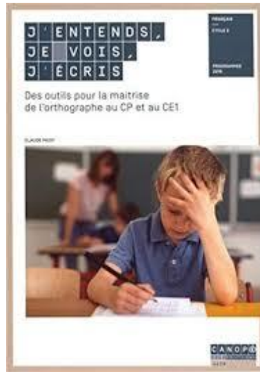
J'entends, je vois, j'écris

Pour chaque phonème combien de phases sont étudiées par les élèves?